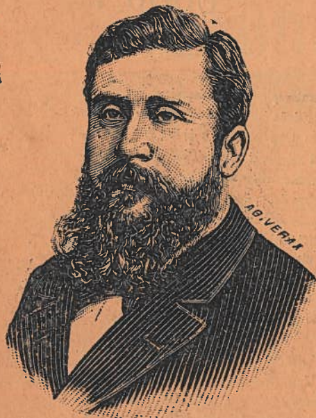
Jean JAURES Députatch det Tarin, néchutch én 1859